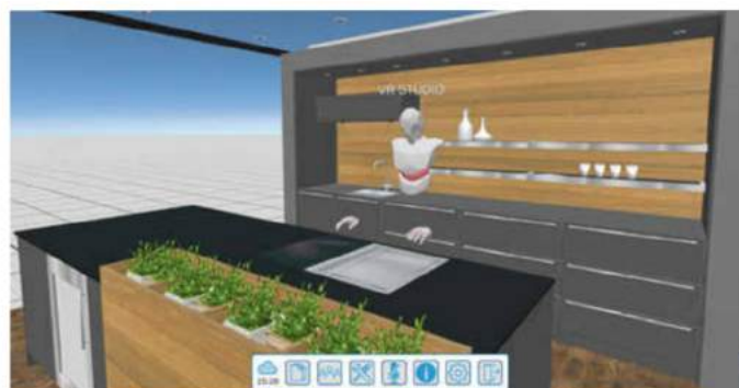
Die Hände oder auch der gesamte Benutzer erscheinen in der Visualisierung als Avatar