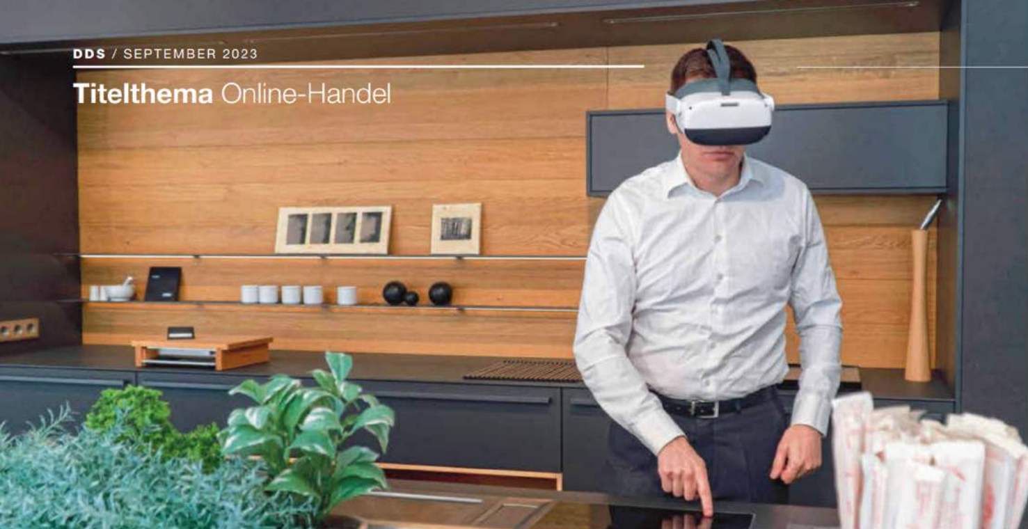
Virtuelle Optionen erweitern für Interessenten das Erlebnis der realen Ausstellungsküche